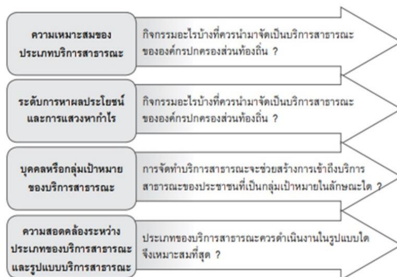
ภาพที่ 2-1 มิติหลักคิดการจัดบริการสาธารณะท้องถิ่นที่ดี

การจัดบริการสาธารณะที่ดี องค์กรปกครองส่วนท้องถิ่นควรตั้งต้นจากการกำหนดหลักการและเป้าหมายที่บอก ว่า “อะไรคือบริการสาธารณะที่ดี” วุฒิสสาร ตันไชยและคณะ (2558) ได้เสนอมิติการพิจารณาประเภทเป้าหมายและวัตถุประสงค์ของบริการสาธารณะที่ควรจัดทำในรูปแบบกิจการพาณิชย์และกิจการเพื่อสังคม การจัดบริการสาธารณะของท้องถิ่นที่ดีควรมีลักษณะอย่างไรได้ 4 มิติ คือ